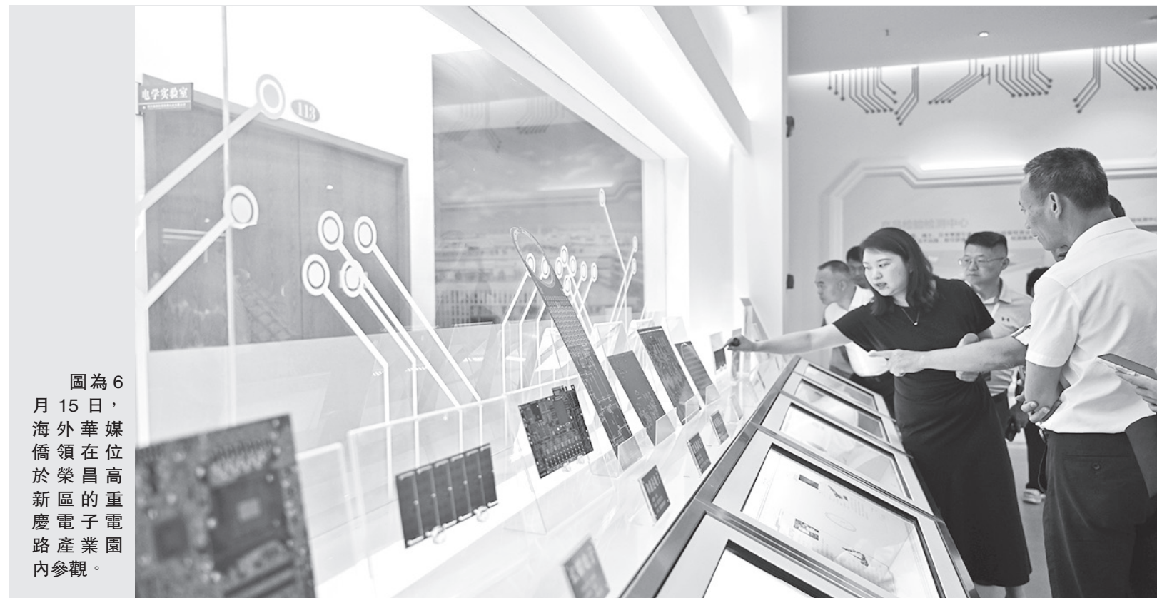
圖為6月15日，海外華媒僑領在位於榮昌高新區的重慶電子電路產業園內參觀。