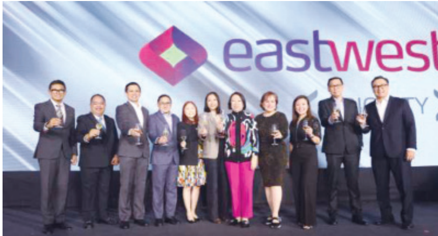
東盛銀行管理層及合作夥伴舉杯慶祝全新「東盛銀行優先理財」體驗正式啟動。

此次推出還透過市場更新、定期經濟簡報及思想領導力會議，強化了銀行作為客戶在把握機遇及應對變化測測的