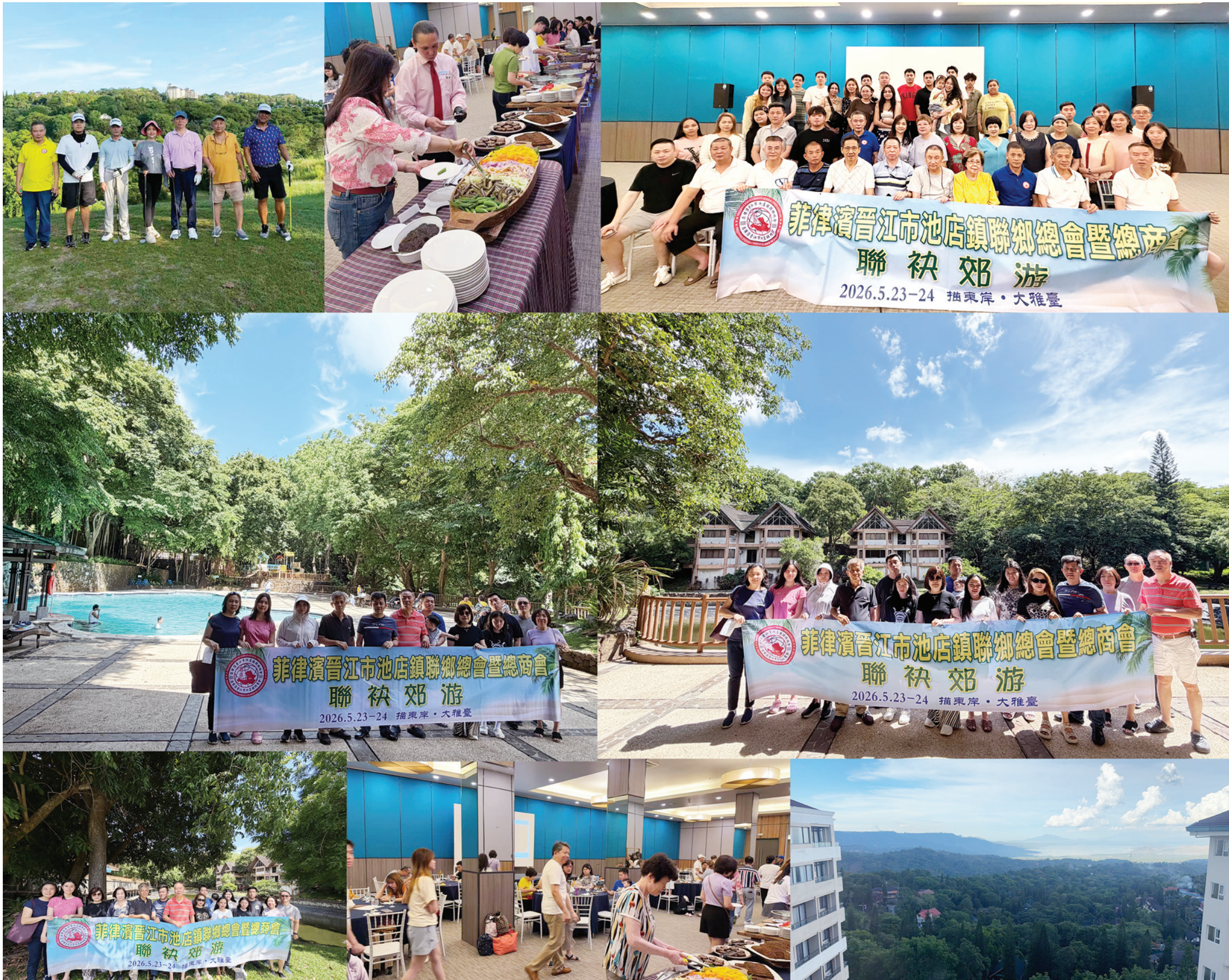
圖片說明：1.在Canyon Woods Golf Course高爾夫球場留影。2. 豐盛午餐。3. 在大雅台anyon woods合影。4. 4.在幽谷密林中定格笑容。5. 在森林環抱的綠色游泳池旁邊留影；6. 在樹木掩映的山間哥特式小築前留影。7. 餐敘一角。8. 大雅台景區鳥瞰圖。

菲律賓晉江市池店鎮聯鄉總會暨總商會訊：遠離都市喧囂，投入山林懷抱。入住大雅臺 (Tagaytay) 度假勝地，在青山翠木間舒展身心、聯絡鄉誼，共度一段溫馨愉快的美好時光。