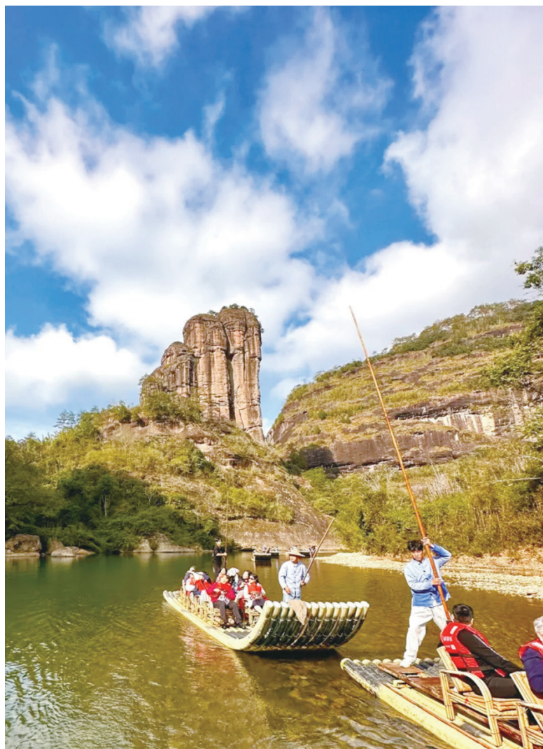
▲從左到右依次為：九曲溪竹筏；採茶；製作中的建盞作品。