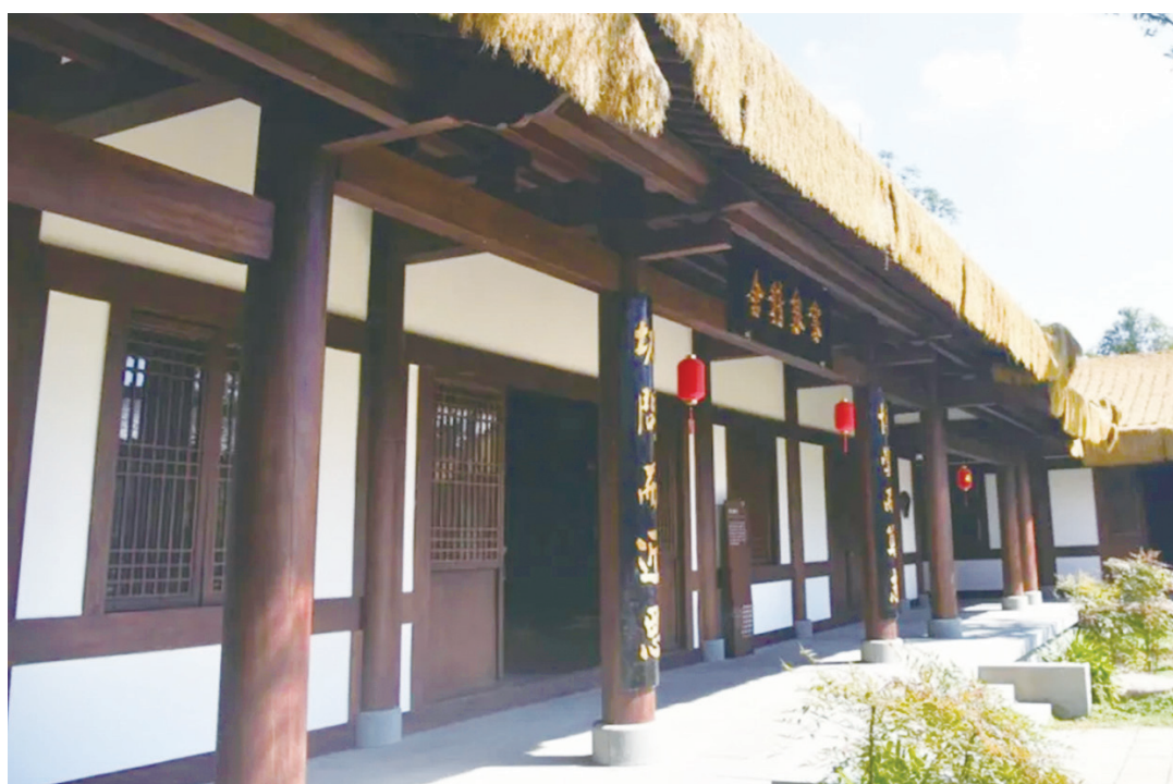
▲寒泉精舍是朱熹創辦的第一所書院。