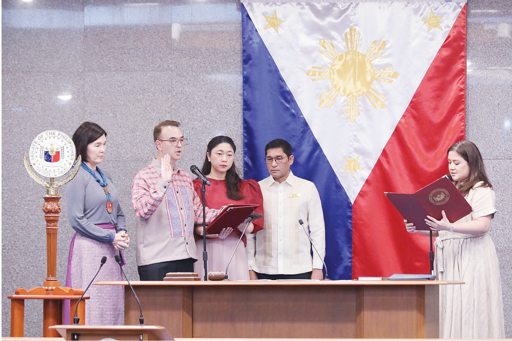
新任參議長艾倫·彼得·加耶丹諾週一在參議員卡米爾·維惹面前宣誓就職。加耶丹諾接替了自2025年9月8日起擔任第20屆國會參議長的未申智·蘇道三世，此前參議員弗朗西斯·伊斯古地洛亦遭罷免。