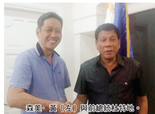
森美·黃 (左) 與前總統杜特地。

他表示，杜特地是在被要求簽署銀行保密豁免書後作出這一承認的。在特里連尼斯引用的一次媒體採訪中，杜特地說：「略低