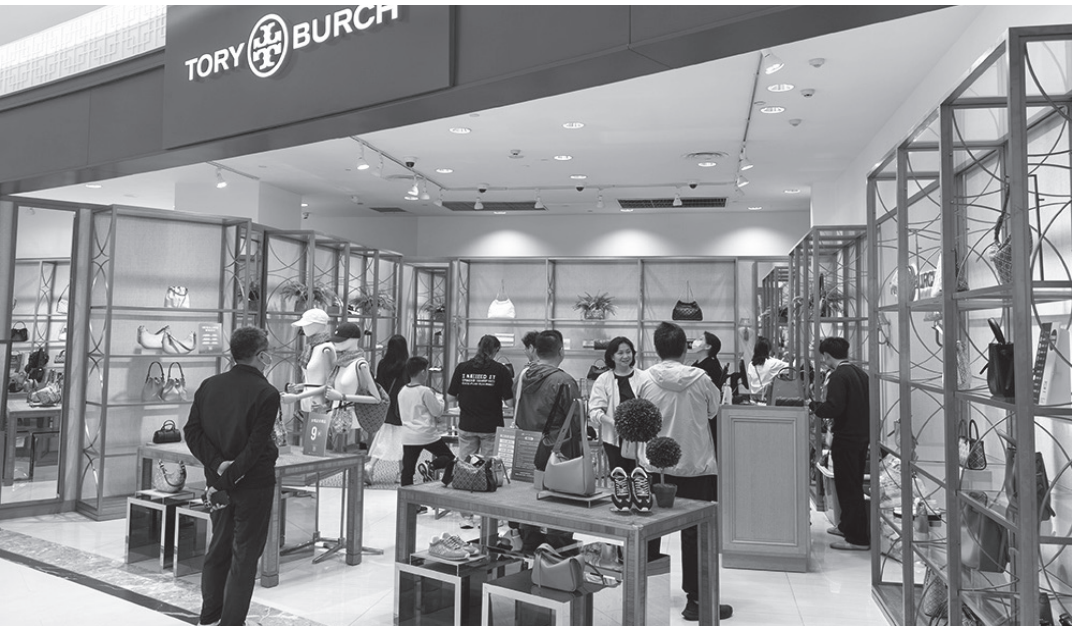
2 月 13 日，消費者在 cdf 海口日月廣場免稅店購物。

「現在平均每天我要參與 10 架次的飛機維修工作，比平時多了幾架次。」海航航空技術有限公司中南維修基地海口維修四室維修工程師蔡熙民在海口說，臨近春節，春運的繁忙感愈發強烈。