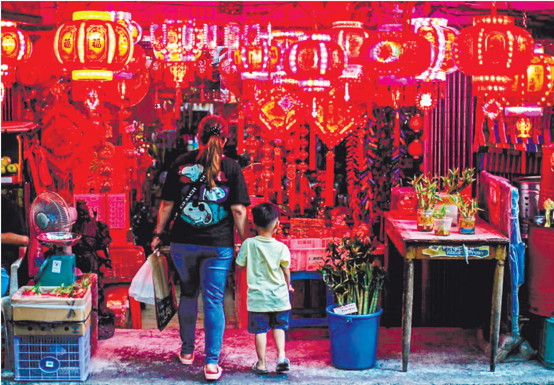
一對母子於1月29日在馬尼拉岷倫洛區的一個攤位尋找小飾品與幸運符。農曆新年（火馬年）將於2月17日開始，該日已被宣佈為全國非工作假日。

本報訊：1月25日至27日，井泉大使先後走訪菲律賓宿務、納卯兩地，受到當地省、市政府，以及華僑華人、中資企業等熱烈歡迎和熱情接待。 井大使分別會見宿務省省長巴里誇特羅、宿務市市長阿奇瓦、納卯市市長塞巴斯蒂安·杜特地及相關省、市議員和主要部門負