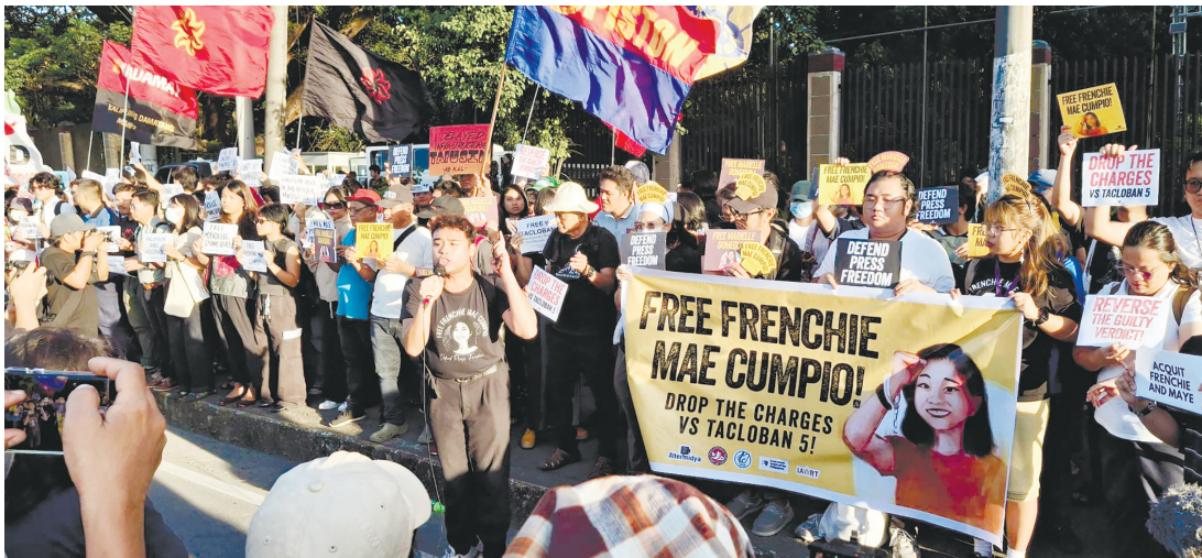
在人權委員會前進行一場示威活動，左派譴責法庭針對兩名記者的資助恐怖主義罪判決。