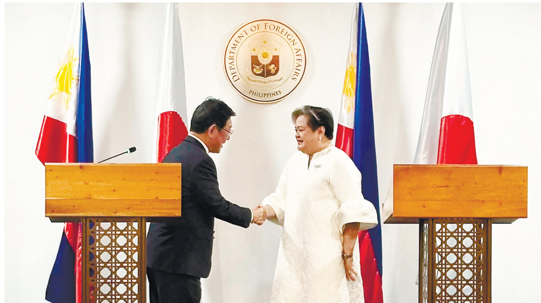
日本外務大臣茂木敏充（左）與菲律賓外交部長特蕾莎·拉扎羅於2026年1月15日星期四在馬尼拉握手。