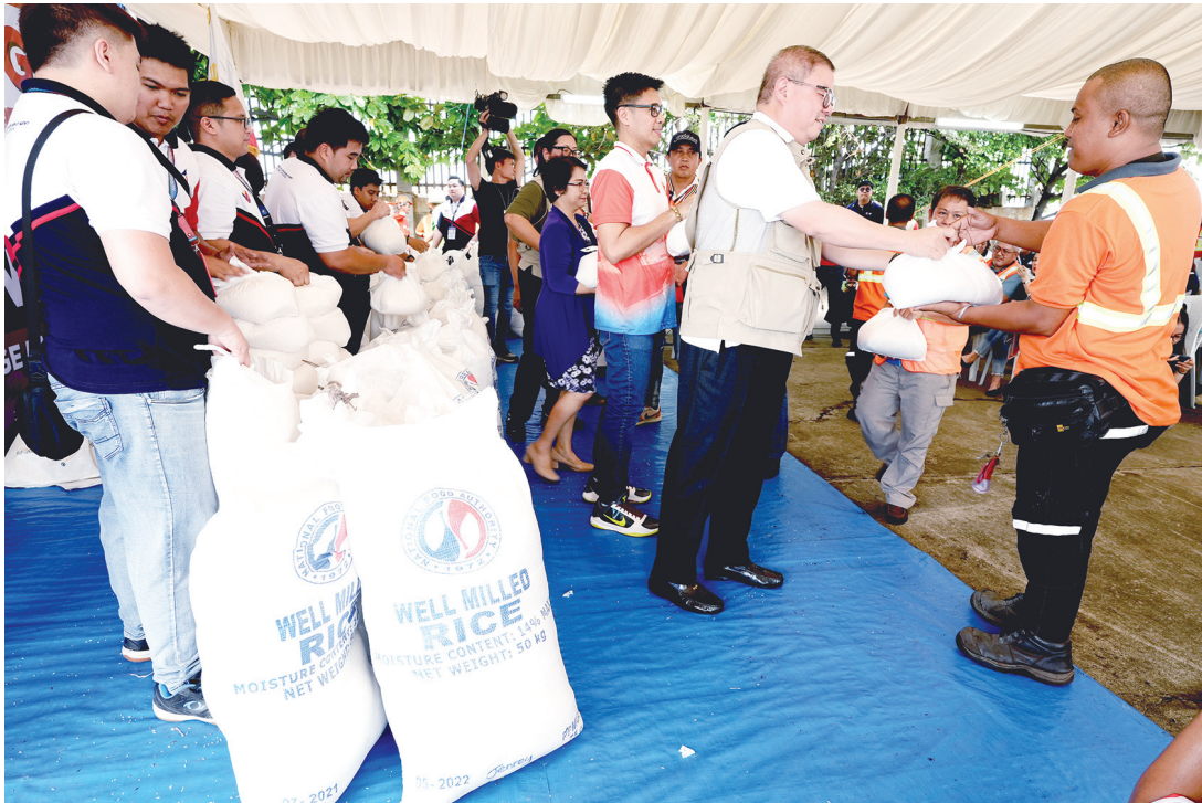
6月13日，農業部長小弗朗西斯科·張·劉禮（著背心者）與勞工部次長本喬·敏那米禮示（左）於馬尼拉敦洛區馬尼拉港區中心主持每公斤20披索平價米發放活動，正式啟動針對最低工資勞工的補助計劃。敏那米禮示表示，預計將有來自約500家企業的12萬名最低工資勞工受惠。