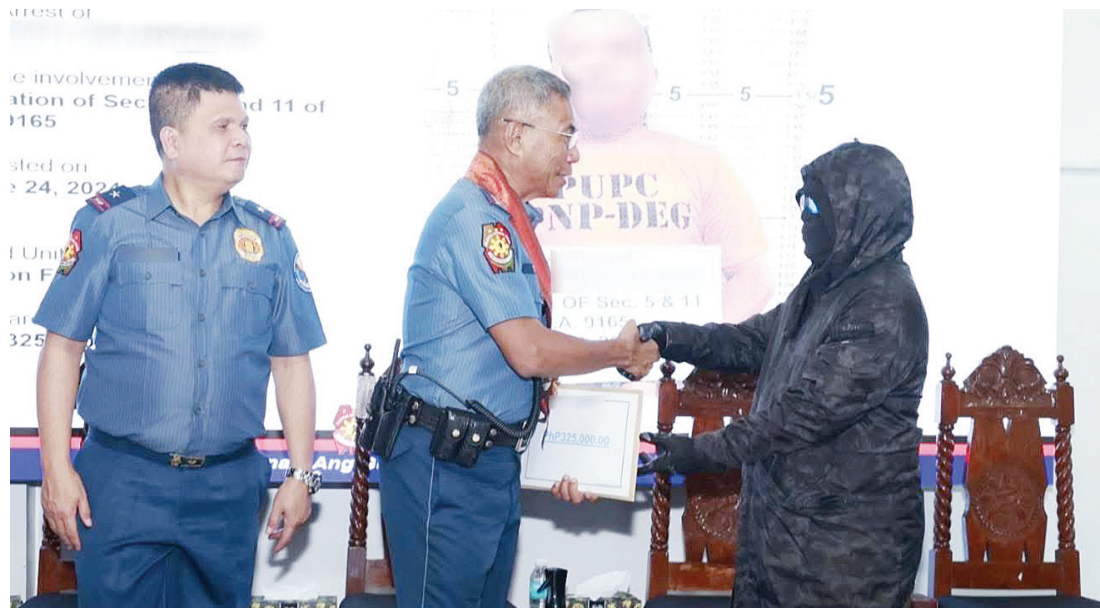
菲國警總監尼古拉斯·托雷三世主持獎勵金頒發儀式，總計發放220萬披索予提供線報協助逮捕重大刑案通緝犯的線民。

菲律賓外交部自2021年起就已把伊拉克列為3級旅遊警示地區；這是菲律賓外交部第2高的旅遊警示等級，意味著這個國家的特定地區正陷於暴力衝突狀態，僑民宜自動離境。