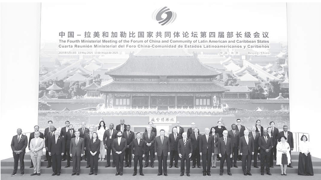
13 日，中國國家主席習近平在北京國家會議中心出席中國－拉美和加勒比國家共同體論壇第四屆部長級會議開幕式並發表主旨講話。這是習近平同與會嘉賓集體合影。

拉共體輪值主席國哥倫比亞總統佩特羅、巴西總統盧拉、智利總統博里奇，新開發銀行行長、巴西前總統羅塞芙分別緻辭。拉共體候任輪值主席國烏拉圭總統奧爾西特別代表宣讀總統賀信。他們高度評價拉中論壇 10 年發展取得的豐碩成果，讚賞中國為推動拉中合作、促進拉美經濟社會發展作出的重大貢獻。各方重申堅定支持一個中國原則。各方表示，習近平主席提出的構建人類命運共同體理念和三大全球倡議，為世界開闢了和平繁榮進步的光明前景。面對充滿不確定性