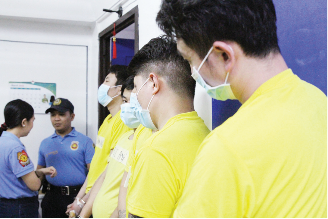
3月12日，五名中國籍人士在巴西市因綁架、持有槍支和麻醉藥品，以及魯莽駕駛導致他人死亡等罪名被捕。