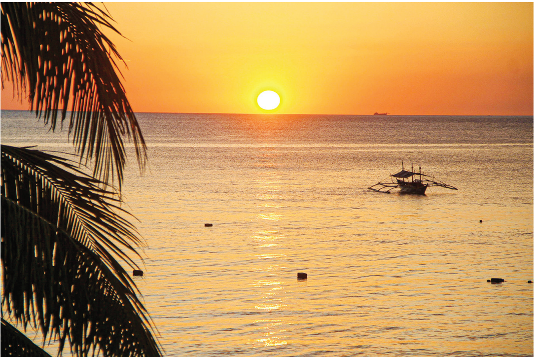
3月12日，從描沓安省莫隆市的Phi-Phi海灘度假村及酒店觀看的日落景色。金色的光芒灑滿天空，為那些渴望暫時逃離大岷區喧囂的人們帶來了一絲寧靜。

儘管這是一起「孤立事件」，但警方承諾該地區仍然安全，並將加強安全措施，例如增加警力部署和巡邏。