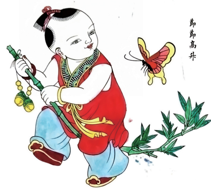
——節節高昇 綿竹年畫 適乙中華中學 劉述濤