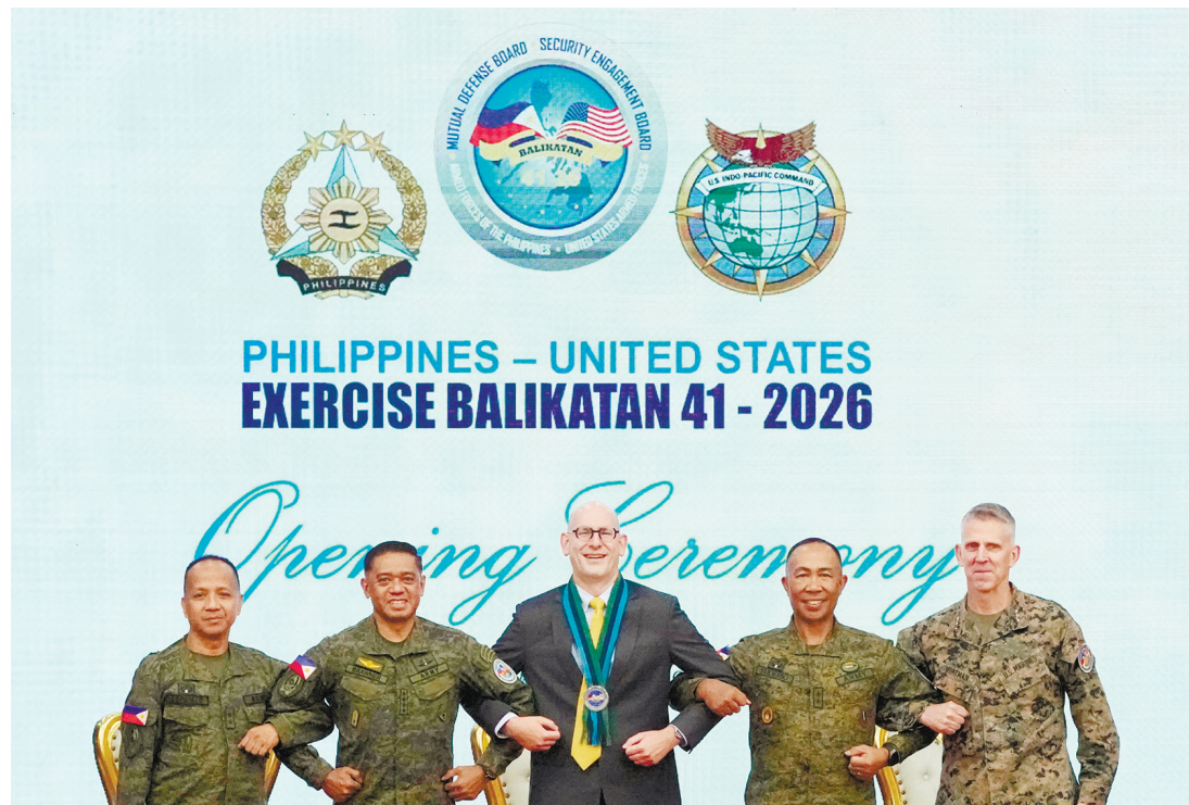
4月20日，在計順市亞銀那洛軍營軍事總部舉行的代號為「肩並肩」聯合軍事演習開幕式上，（左起）菲律賓演習主任小弗朗西斯科·羅仁樹少將、菲律賓武裝部隊總參謀長羅密歐·布勞納將軍、美國使館代辦Y·羅伯特·尤因、菲律賓負責行動的副參謀長J3部門埃爾默·蘇德里奧少將以及美國海軍陸戰隊第一遠征軍司令克羅斯蒂安·沃特曼中將合影。