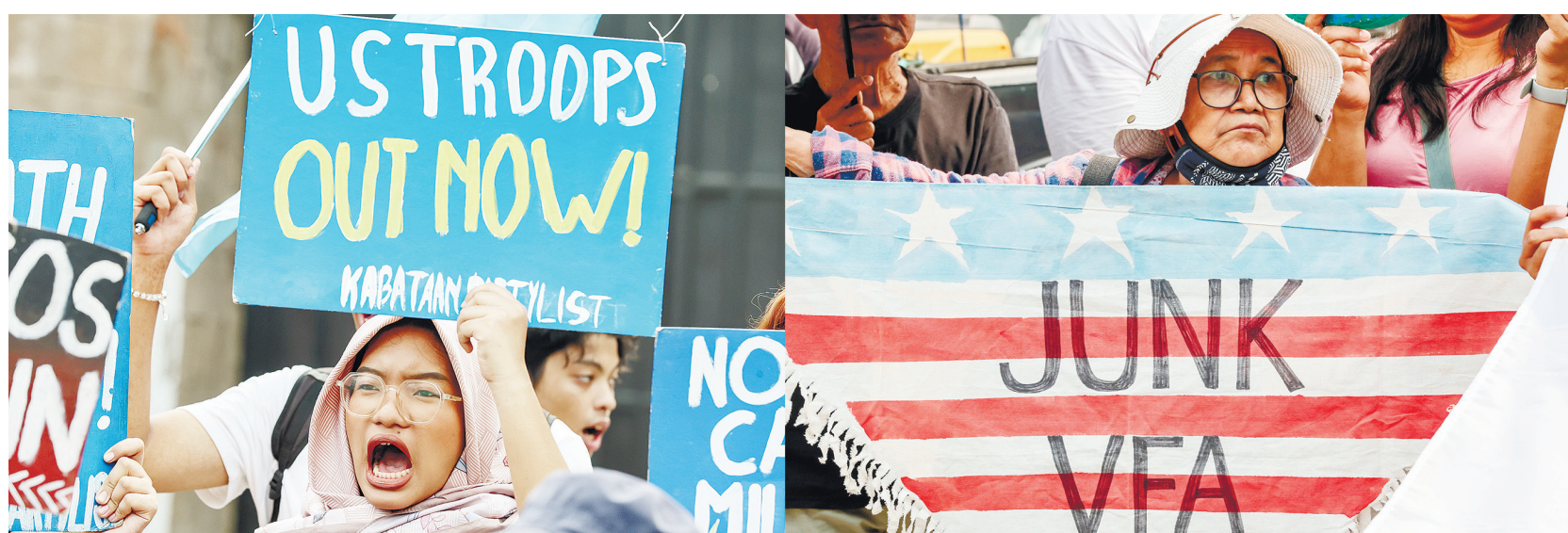
4月20日，民眾手持標語在菲律賓武裝部隊總部外集會抗議。菲律賓和美國「肩並肩」聯合軍事演習20日在菲首都馬尼拉啟動。菲律賓民眾當天在菲武裝部隊總部外集會，抗議菲美舉行聯合軍演。