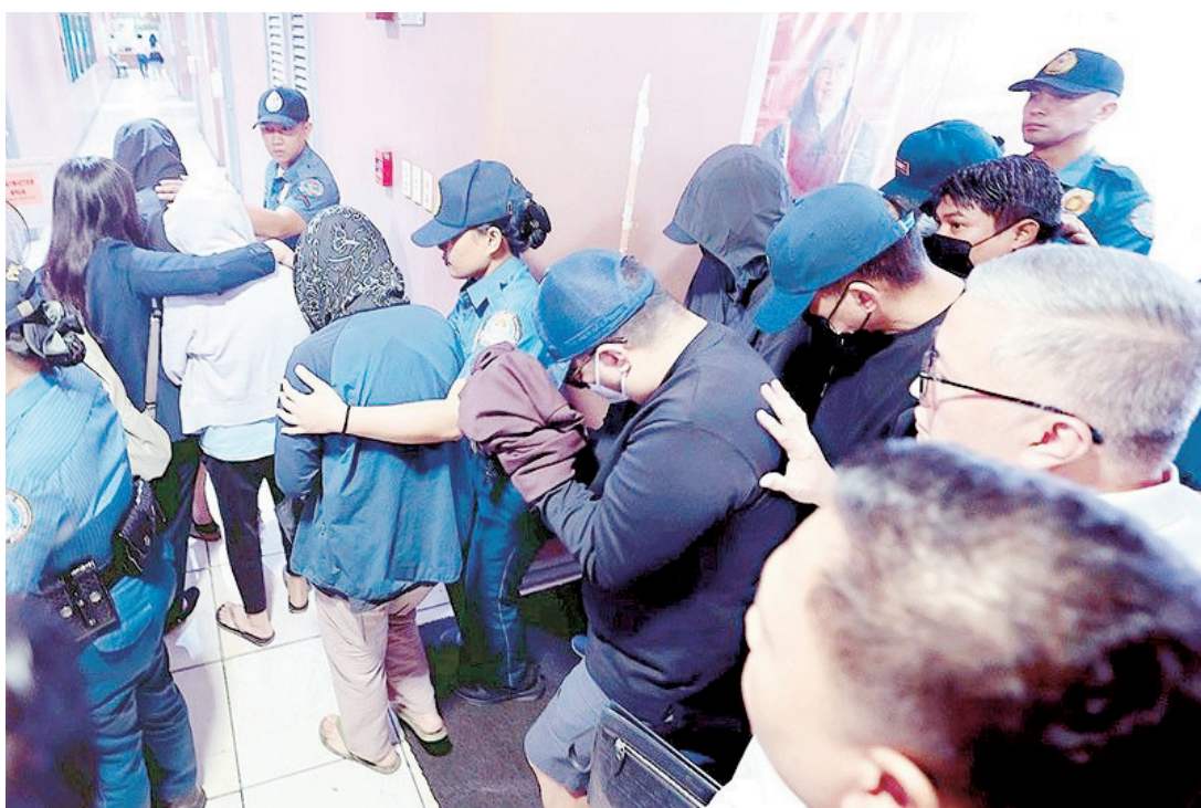
涉及東岷多洛防洪工程舞弊案的8名被告，昨日被押送至廉政法庭，以進行登記並簽發羈押令。

足的安保。根據我們聽到的消息，他們已經加入了一個幫派。就是『他們是洪水幫』（Baha na Sila Gang）。他巧妙地運用了防洪控制與『聽天由命幫』（Bahala na Gang）的雙關語，後者是我國懲教系統中一個長期存在的受刑人團體。