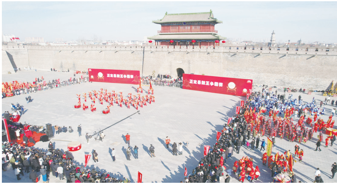
▲2023年1月31日，第十八屆鼓王爭霸賽在正定古城賽城內舉行。當日，來自該縣的12支民俗戰鼓隊輪番上陣，展示常山戰鼓風采。常山戰鼓於2008年入選中國國家級非物質文化遺產項目名錄。

精巧華麗的明清仿古建筑群，再現了《紅樓夢》中的「金門玉戶神仙府，桂殿蘭宮妃子家」。 「國乒福地 冠軍搖籃」——正定國家乒乓球訓練基地，主要擔負著中國國家乒乓球隊在世界大賽前的封閉訓練任務。鄧亞萍、王楠、張怡寧、孔令輝、劉國梁、馬琳、王勵勤等，都曾在這裡訓練後出征獲得世界冠軍，因而正定基地被稱為培養世界冠軍的「搖籃」，訓練基地則被中國國家乒乓球隊譽為「福地」。