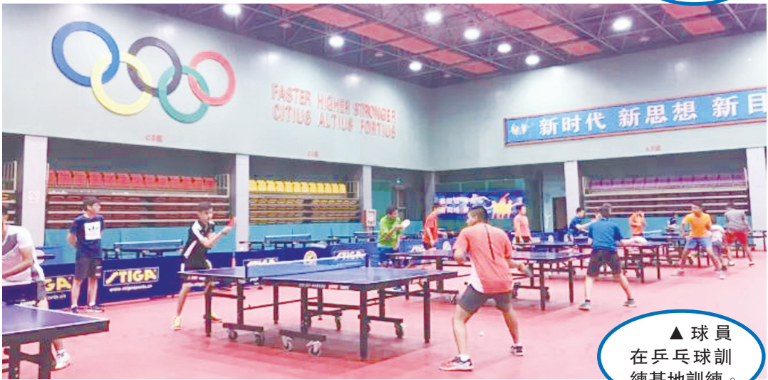
▲球員在乒乓球訓練基地訓練。