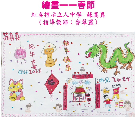
繪畫——春節 紅英禮示立人中學 蘇真真 （指導教師：魯翠麗）