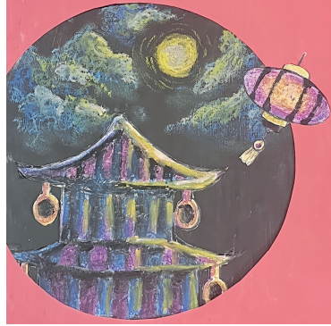
繪畫——元宵佳節夜賞月 計順菲華中學 陳敏德 （指導教師：邊貝貝）