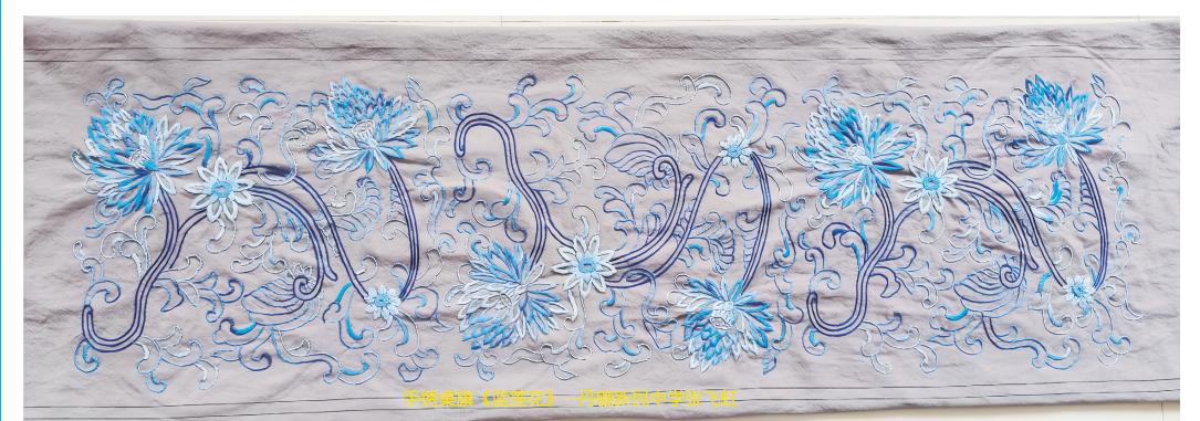
手繡工藝品——桌旗《藍蓮花》 丹轆新民中學 張飛虹

於是，我決定不再匆匆趕路，而是學會放慢腳步，用心去感受生活中的每一份美好。無論是雨季的細雨綿綿，還是星空的璀璨奪目，都是生活賦予我們的寶貴財富。讓我們珍惜這些瞬間，用心去感受、去體驗、去珍惜，讓生命因這些美好而變得更加豐富多彩。