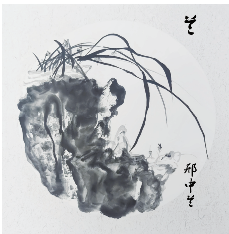
國畫——蘭 北黎利育仁中學 邢中蘭

我在每週的班級活動中，都準備了許多獎品送給孩子們，孩子們偶爾給我一顆芒果、一袋餅乾，如此和諧的師生關係讓我數次陶醉。我想，儘管我們之間在語言上還要加強溝通，但是彼此在情感上早已日臻完美。我深深地渴望在菲律賓華文教育工作中，通過不斷地實踐與改革，形成一套教學相長的理念與方法。我篤定，彼此欣賞的課堂才是真正靈動、和諧、活躍、同心合力的。