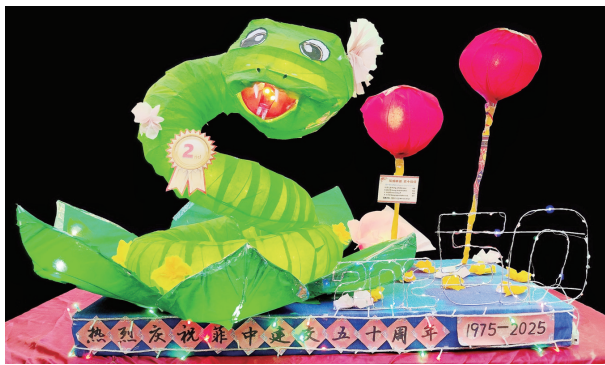
花燈——龍蛇共舞，五十同輝 僑中學院總校 黃光榮/黃文斌/林佳霖/王美琳 （指導教師：鑒康利）