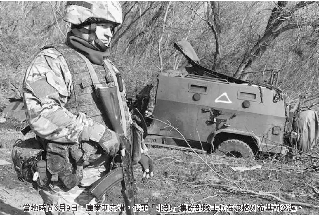
當地時間3月9日，庫爾斯克州。俄軍「北部」集群部隊士兵在波格列布基村巡邏。

H-07公路蘇梅到邊境段，由此成為一條真正的「死亡之路」。烏克蘭媒體披露的數據顯示，每一天，在路上被擊毀的烏軍各類