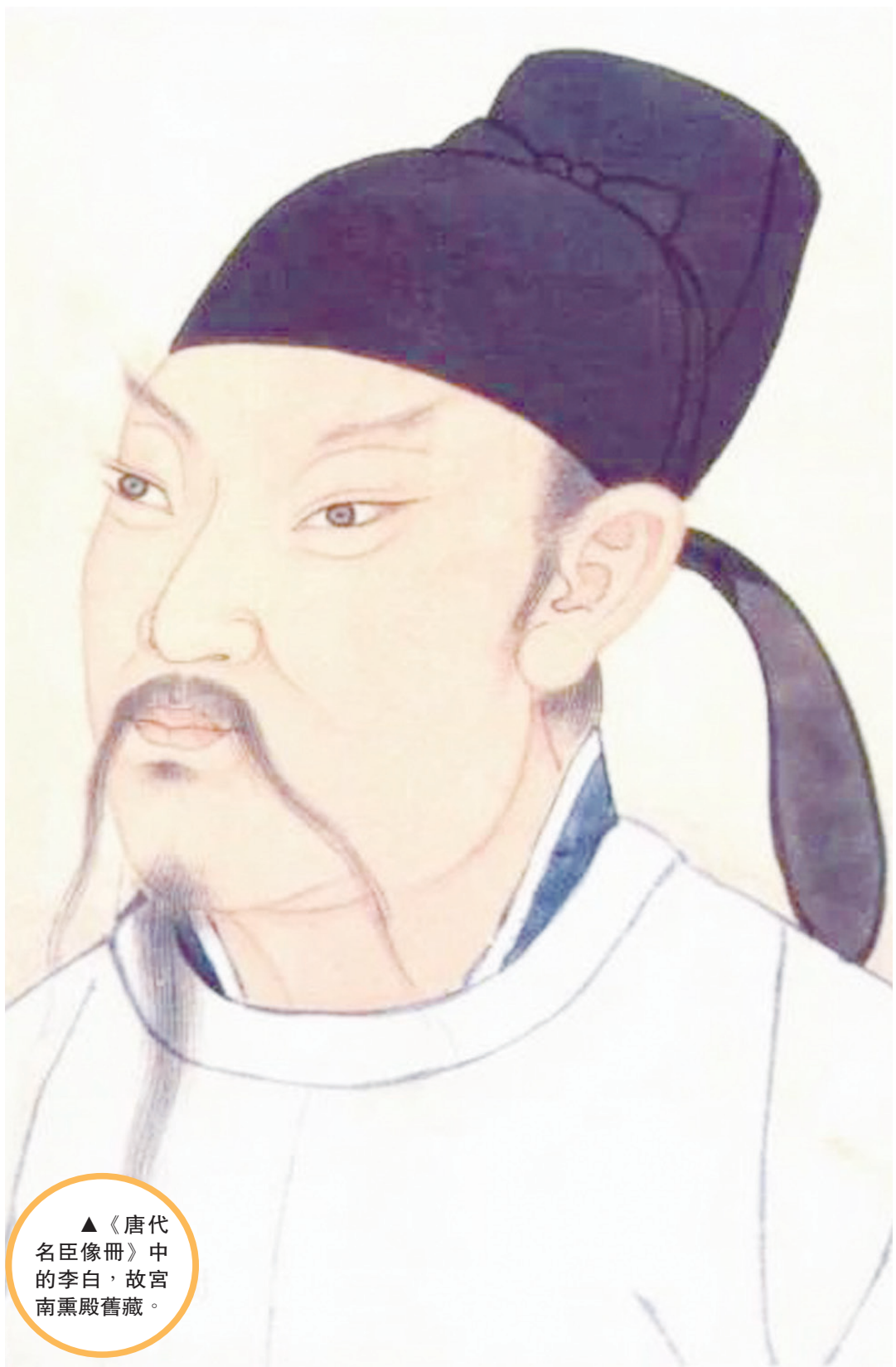
▲《唐代名臣像冊》中的李白，故宮南薰殿舊藏。

知名的《大鵬賦》《上安州裴長史書》《代壽山答孟少府移文書》《上安州李長史書》《與韓荊州書》等，是研究李白這一時期思想、行跡的寶貴資料。這些文章大都氣勢豪邁，語言明快，表現出強烈的進取精神和高度的自信心。 李白在荆楚寫下的詩文多達百餘篇，其中有不少為其代表作。除了在安陸十年，還在以江夏為中心的沿江上下遊歷，時間是乾元元年到上元元年（公元758年至公元760年）流放夜郎遇赦前後，有詩文40餘篇。 流放途中，李白路過江夏、漢陽，在兩城流連數月，留下了詩集中最長的名作《經亂離後天恩流夜郎，憶舊遊，書懷贈江夏太守良宰》，詩中述其平生行事，尤詳於安史之亂爆發、入永王璘幕府及流放夜郎前後的情況，並能將個人的遭遇和百姓的命運聯繫起來，發出擲地有聲的吶喊：「白骨成丘山，蒼生竟何罪！」 遇赦後的李白欣喜異常，《早發白帝城》詩云：「朝辭白帝彩雲間，千里江陵一日還。兩岸猿聲啼不住，輕舟已過萬重山。」復還江夏時，他還在《與史郎中欽聽黃鶴樓上吹笛》一詩中，以「黃鶴樓中吹玉笛，江城五月落梅花」的名句，為武漢這座城市留下了「江城」的美名。 令人印象深刻的是，在電影《長安三萬里》中，美輪美奐的黃鶴樓多次出現，與黃鶴樓有關的詩歌也被多次吟誦。顯然，黃鶴樓不僅屬於武漢，而是大唐盛世的一個重要精神象徵。 李白自稱「楚狂人」，在荆楚居遊十多年，足跡遍佈各地，不只是發思古之幽情，而是廣泛接觸社會各階層，在詩文創作中充滿了時代氣息和人文精神。應該說，人傑地靈的荆楚大地滋養了李白的浪漫情懷，其詩文中豪放飄逸的個性就是在充分汲取時代營養，同時也深受楚文化傳統浸染的基礎上形成的。 誠如知名國學大師程千帆在為《唐詩鑒賞辭典》所作《序言》中稱：「李詩大源出於《楚辭》。」而李白的天才，無疑也賦予了荆楚風物永恆的文化魅力。作者/趙慶偉 本版圖文除署名外均據《中國民族報》