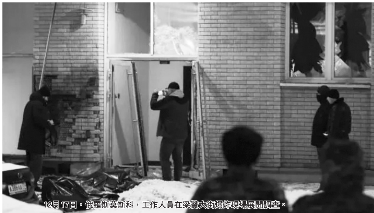
12月17日，俄羅斯莫斯科，工作人員在梁贊大街爆炸現場展開調查。