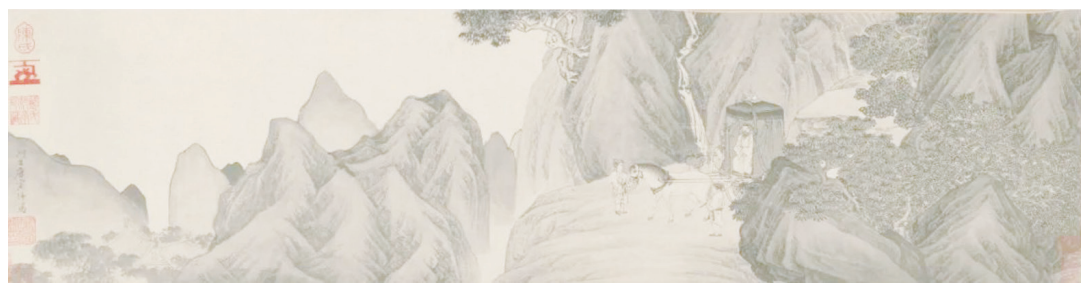
▲明 唐寅《王公拜相圖》北京故宮博物院藏