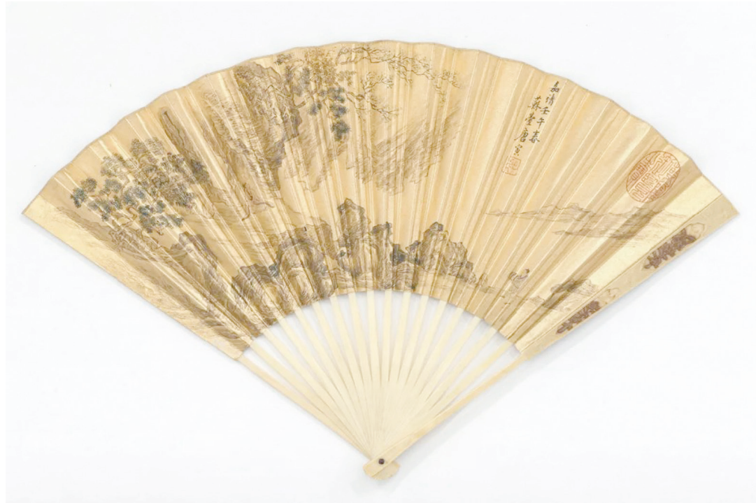
▲明 唐寅 畫看山圖並自書七言絕句成扇 台北故宮博物院藏

相似的詩還有：「東甌倦客又西征，路入芝田已絕腥。每日三廚都是筍，看看滿腹萬竿青。」這位每日三餐頓頓吃筍，吃到懷疑自己肚子裡能長出一片竹林。