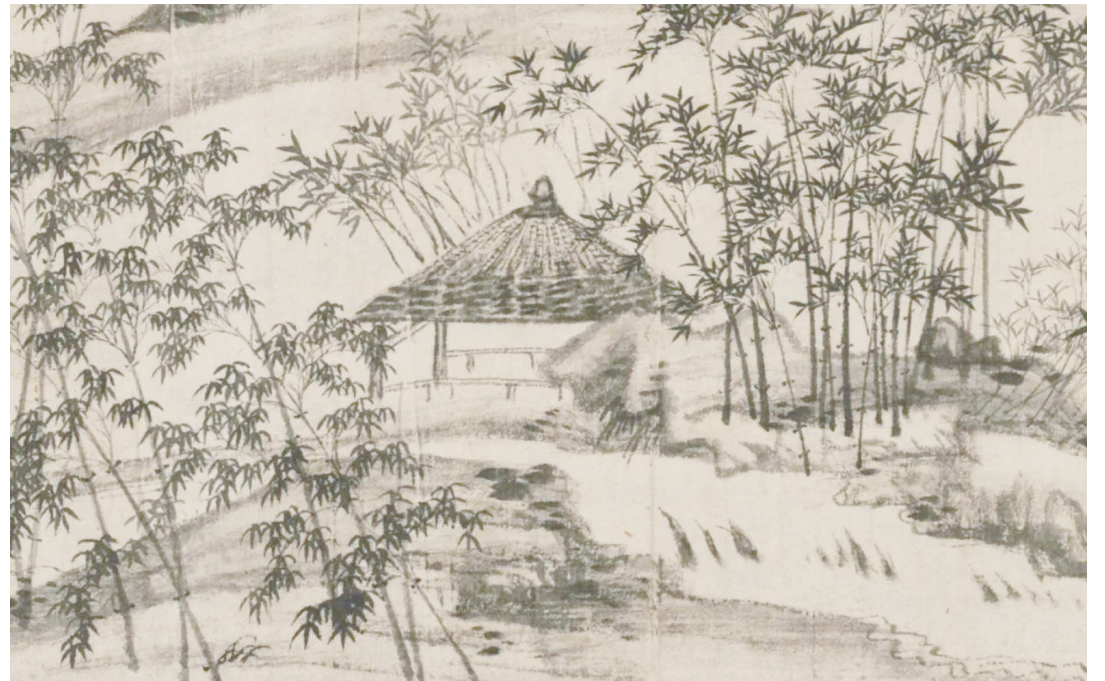
▲明 宋克《竹林茅屋圖》（局部）克利夫蘭藝術博物館藏

不過在唐寅生前無人問津的作品，在他死後卻賣出了天價。若他泉下有知，不知該有如何感想。