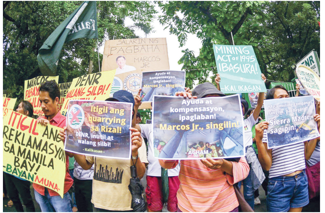
週三，洪水倖存者、漁民和環保組織遊行到位於計順市的環境和自然資源部總部，要求取消寮刺省的採礦和採石許可證。

隨後，他敦促情報界將郭華萍列入關鍵信息的調查範圍，並進行更深入的記錄查核和背景調查。