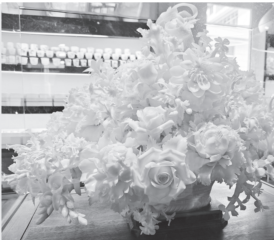
▲福建德化陶瓷因白如雪、明如鏡、薄如紙、聲如磬、潤如玉而享譽世界，被讚譽為「中國白」。