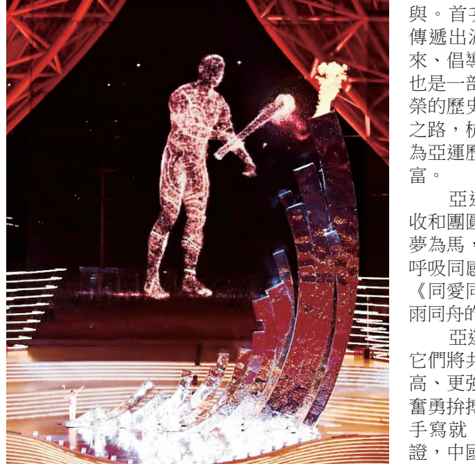
9月23日，最後一棒火炬手汪順和「數字火炬手」在開幕式上點燃主火炬。當日，第19屆亞洲運動會開幕式在杭州舉行。

首金引人矚目，其他賽場的對決同樣精彩。游泳賽場產生7枚金牌，中國隊三位世界級名將張雨霏、覃海洋、汪順將領銜出擊。報名七個小項的「雙後」張雨霏，將從女子200米蝶泳開始此次亞運征程；男子200米混合泳