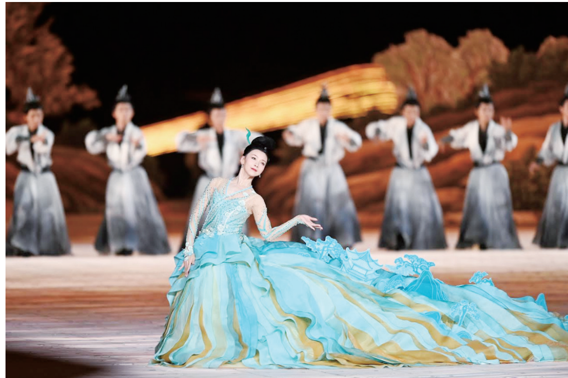
第19屆亞洲運動會開幕式在杭州舉行 9月23日，舞蹈演員在開幕式上表演。當日，第19屆亞洲運動會開幕式在杭州舉行。

這是一場意蘊悠長的文化盛宴。採集於良渚古城遺址的火炬，歷經一路傳揚，最終點燃主火炬，恰似中華五千年文明薪火相傳、生生不息；文藝演出上篇《國風雅韻》盡展錢塘繁