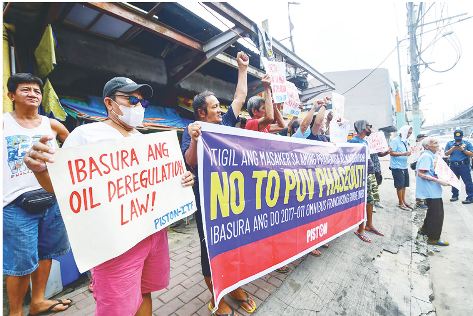
圖為運輸組織PISTON促政府廢除石油解管法，來遏止不斷上升的油價。能源部說，油價高企將持續到12月。