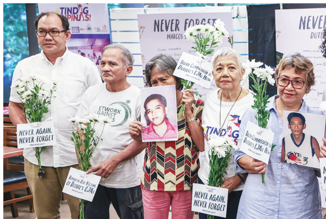
人權受害者組織Tindig Pilipinas的成員昨日在計順市舉行記者會，紀念已故獨裁者馬科斯宣布軍管51週年，以及杜特地政府治下的法外處決受害者。他們呼籲全面實施軍管法受害者人賠償法以及成立真相調查委員會，調查杜特地政府的法外處決案件。