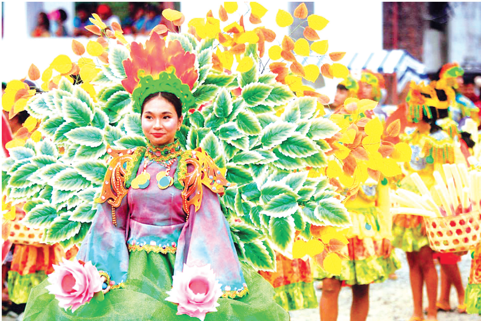
週二，在馬仁俞計省的博阿克社，高中生們穿著蝴蝶服裝參加Bila-bila街舞表演。馬仁俞計被譽為菲律賓的蝴蝶之都，是我國大多數蝴蝶種類的家園，蝴蝶養殖被視為該省的主要產業之一。

本報訊：參議員洪智維洛斯昨天表示，菲離岸博彩運營行業（網絡博彩）已成為菲國「詐騙中心」的「合法掩護」，她指責菲律賓娛樂博彩公司（PAGCOR）未能阻止新的「作案手法」。