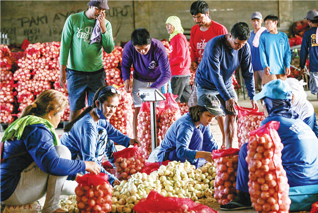
圖為慈描伊絲夏省的農民正在準備洋蔥。該省被譽為菲律賓的洋蔥之都，目前正進入收穫季節，洋蔥價格也從12月的每公斤800披索將至目前的300披索。

博士學位。龔博士研究專注研究二十世紀華人移民以及中國與東南亞的關係。他目前的書籍項目是1970年代和1980年代新加坡——中國大陸——台灣文化關係的歷史。