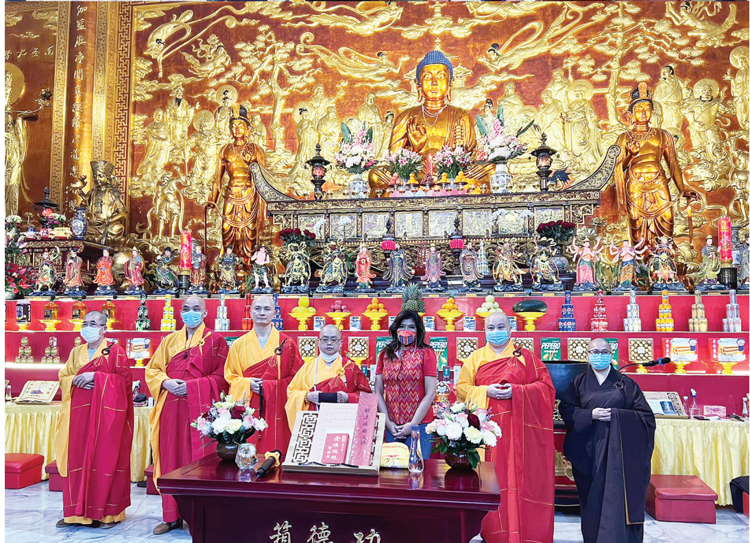
圖一：參議員愛蜜馬可斯除夕夜撞鐘祈福。圖二：參議員馬可斯（右三）與本寺副寺門清法師（左四）及其他法師在藥師殿合影留念。圖三：參議員馬可斯在藥師殿拈香禮佛致敬。

信願寺訊：菲律賓共和國參議員，現任總統令姐愛蜜馬可斯女士閣下，于1月21日晚十一時半（農曆除夕夜）蒞臨本寺參訪禮佛，拈香祝禱。