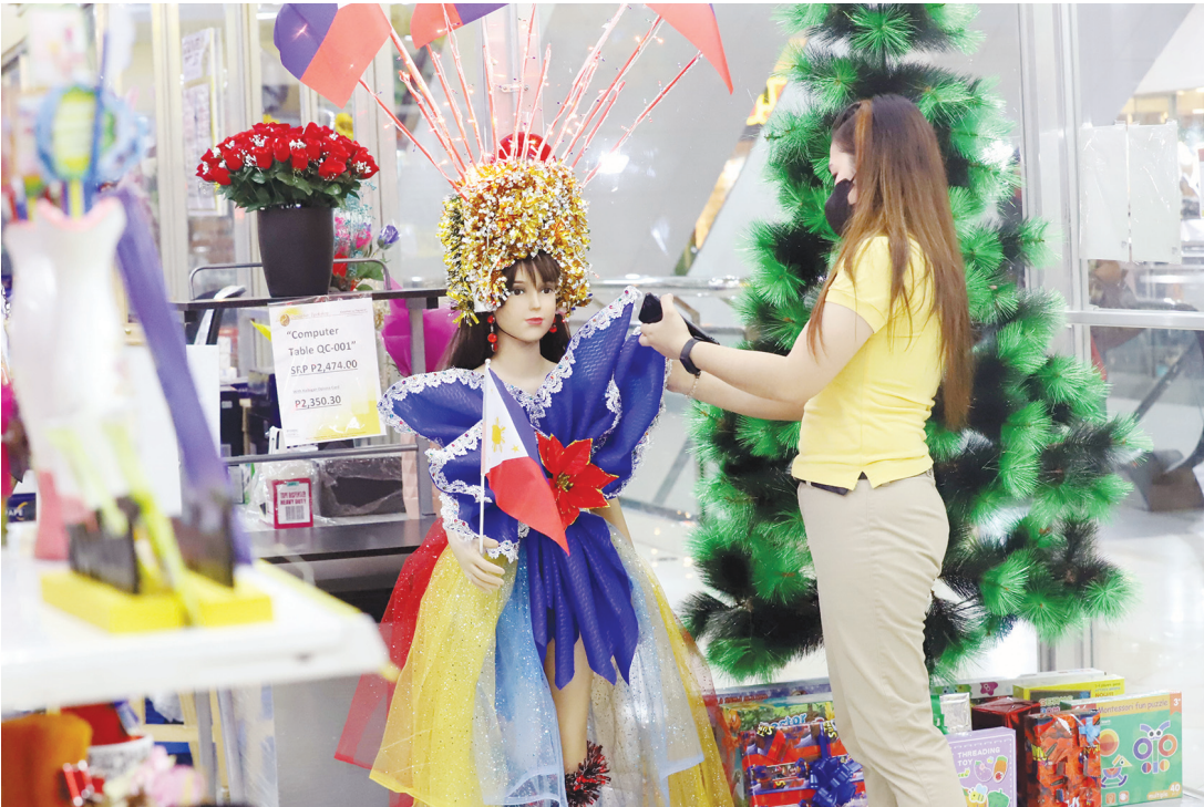
週三，計順市龜卵區的Pandayan書店，一名店員在為他們的聯合國日主題準備展覽。每年的10月24日是聯合國日。