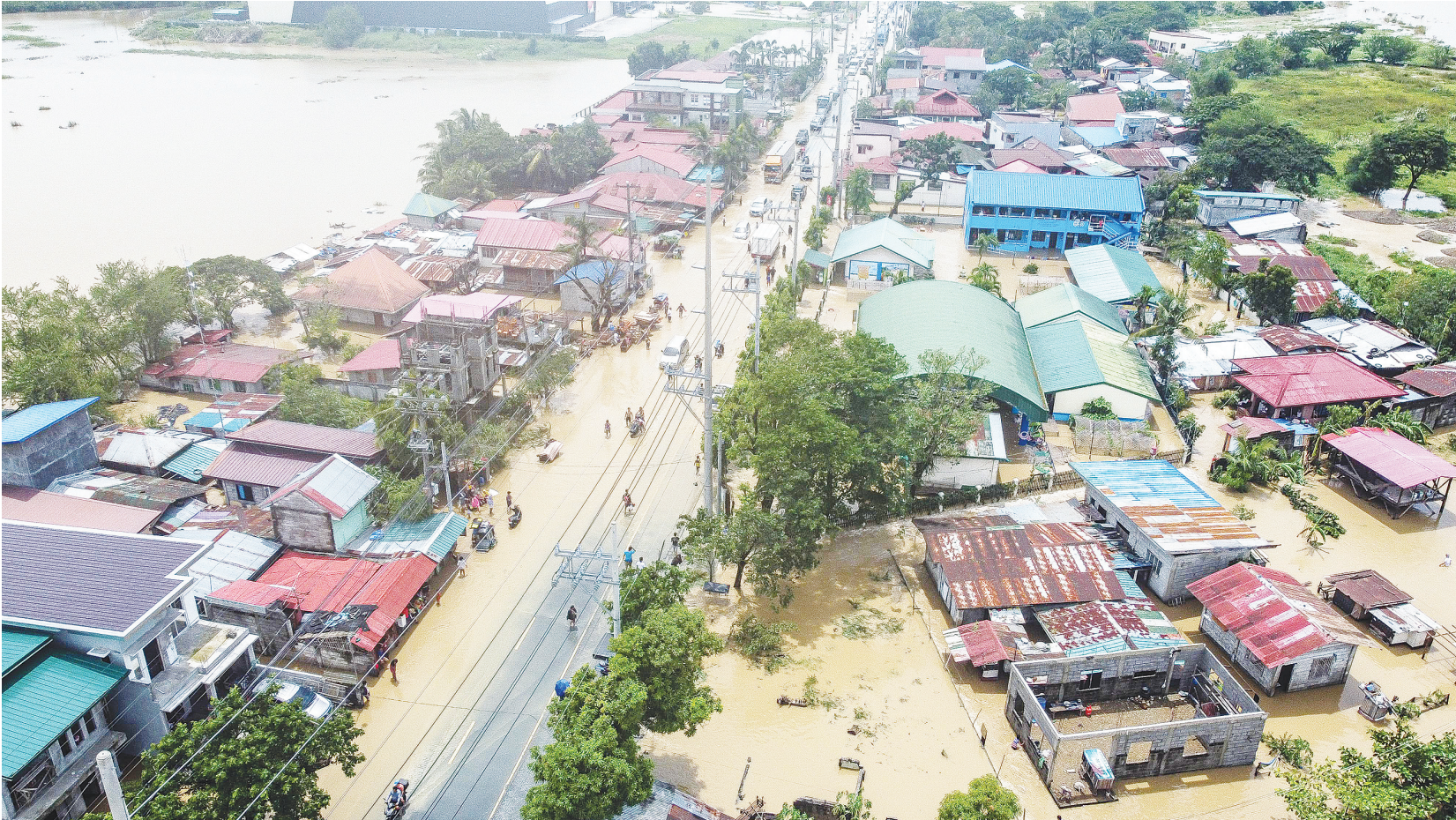
這是9月26日在菲律賓布拉幹省航拍的遭洪水侵襲的區域。菲政府官員26日說，超強颱風「卡丁」25日登陸菲律賓以來，給呂宋島多地帶來強降雨和大風，已造成5人死亡。