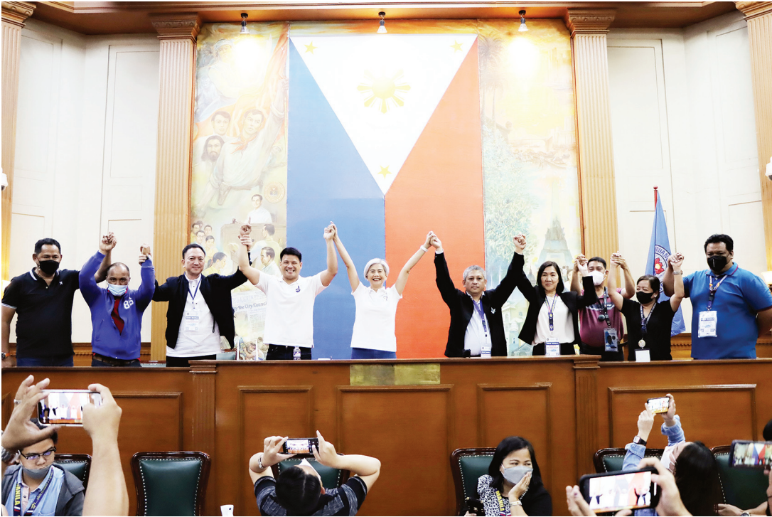
圖為選舉署官員昨日公告現任馬尼拉副市長哈妮·拉古那當選市長。

馬科斯在競選造勢期間對於他的政見著墨不多，但外界普遍認為，他將緊密追隨即將卸任的菲律賓總統杜特地路線，杜特地的施政重點放在大型基礎建設計畫，和中國維持密切關係以及追求強勁經濟成長。