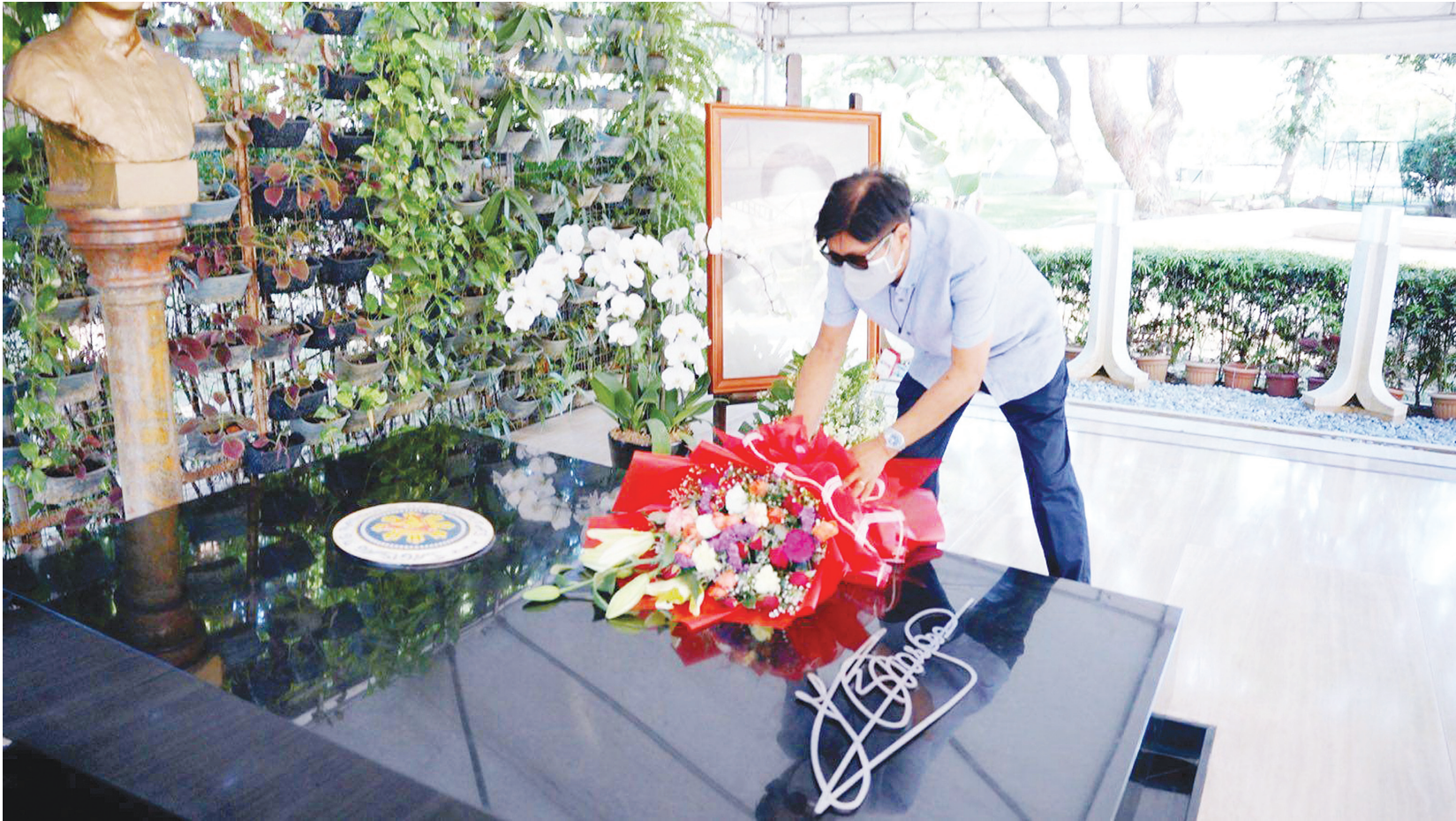
圖為候任總統小馬科斯昨日前往他父親、前獨裁者馬科斯的墳墓獻花。