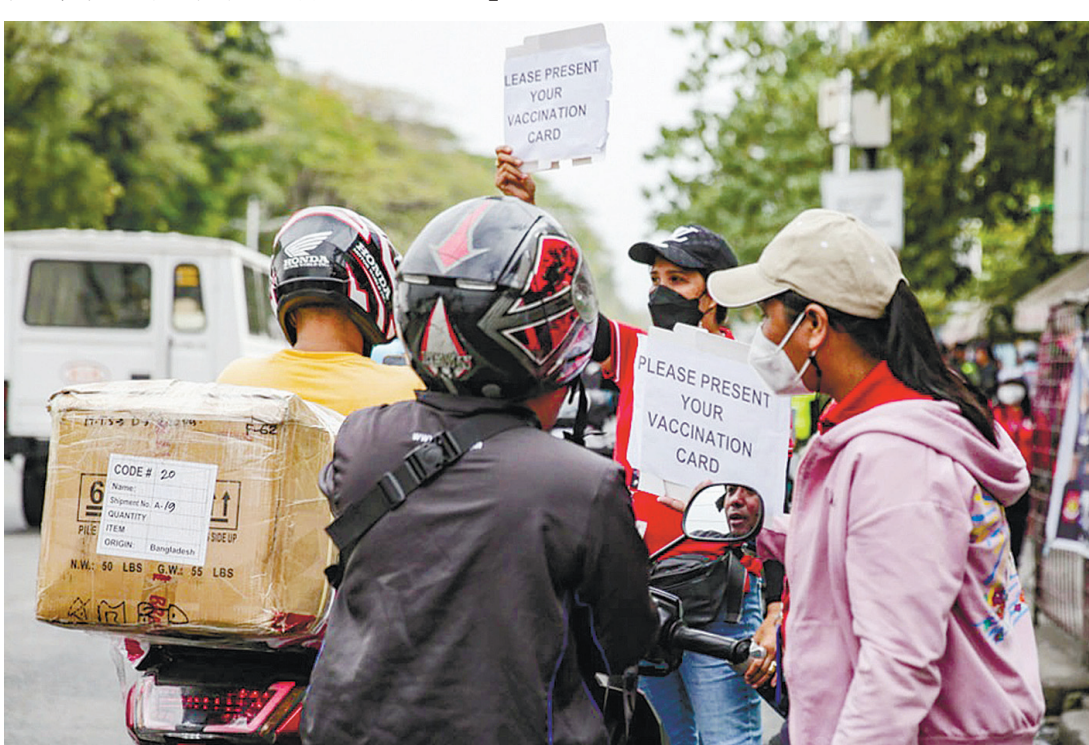
圖為養基市一條繁忙街道的描籠涯官員昨日檢查行人的疫苗卡。當地政府設立疫苗卡檢查站，並加強限制未打疫苗的人士外出。

她補充：「話雖如此，我們將確保我們與中國或任何其他國家的關係始終建立在相互信任、尊重和承認國際法的基礎上。」