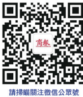
請掃描關注微信公眾號