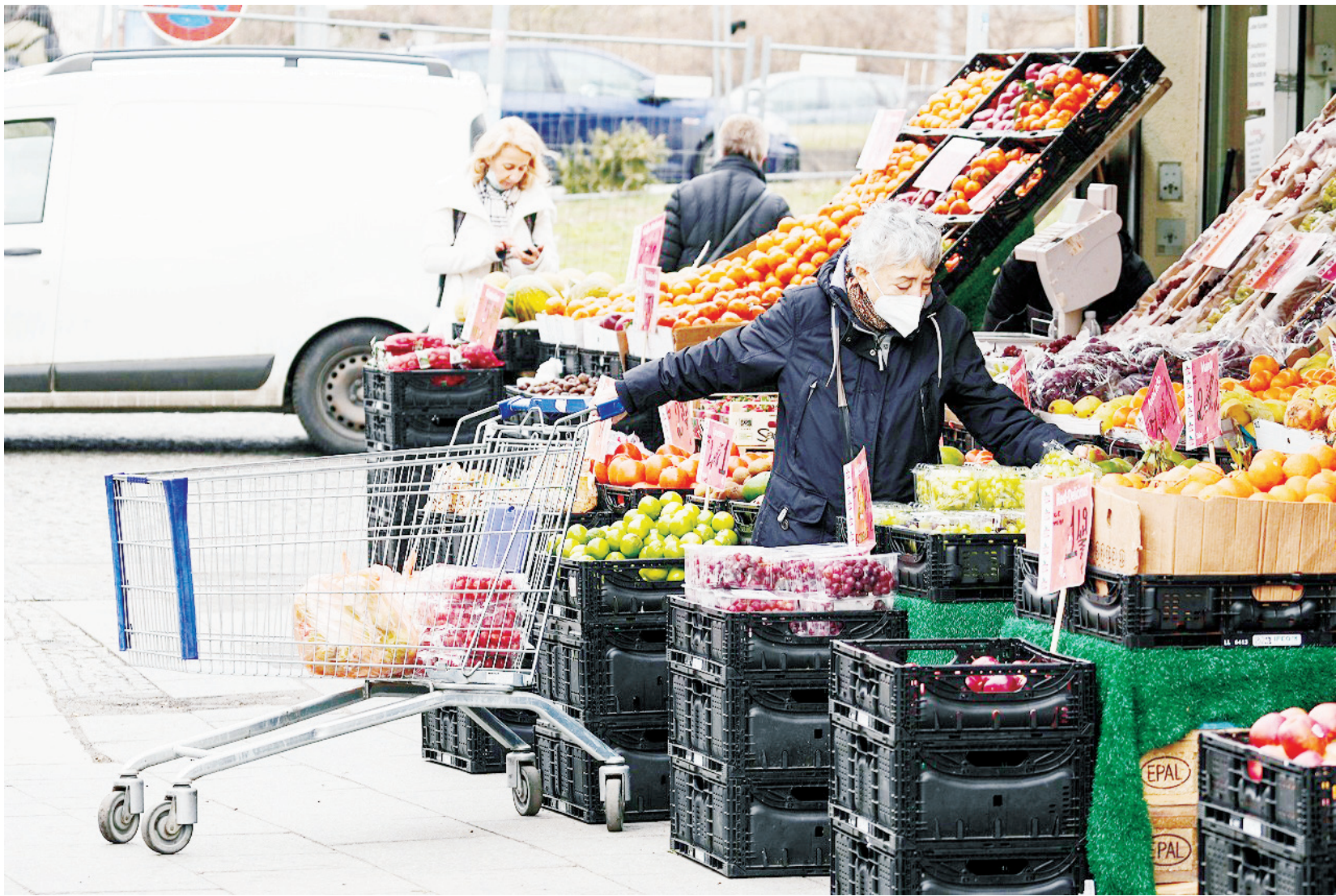
德國2021年通脹率創近30年新高

今年與Goldilocks一起喜慶春節！從2022年1月15日至2月6日，您可以在全國各地的Goldilocks分店直接訂購，或撥打Goldilocks熱線8888-1999或在goldilocksdelivery.com.ph網上訂購，可享有折扣優惠。當您通過Grab和Foodpanda訂購時，售價是正常價格。更多信息，您可以在臉書、推特和Instagram上關注@GoldilocksPH，或訪問Goldilocks的官方網站www.goldilocks.com.ph