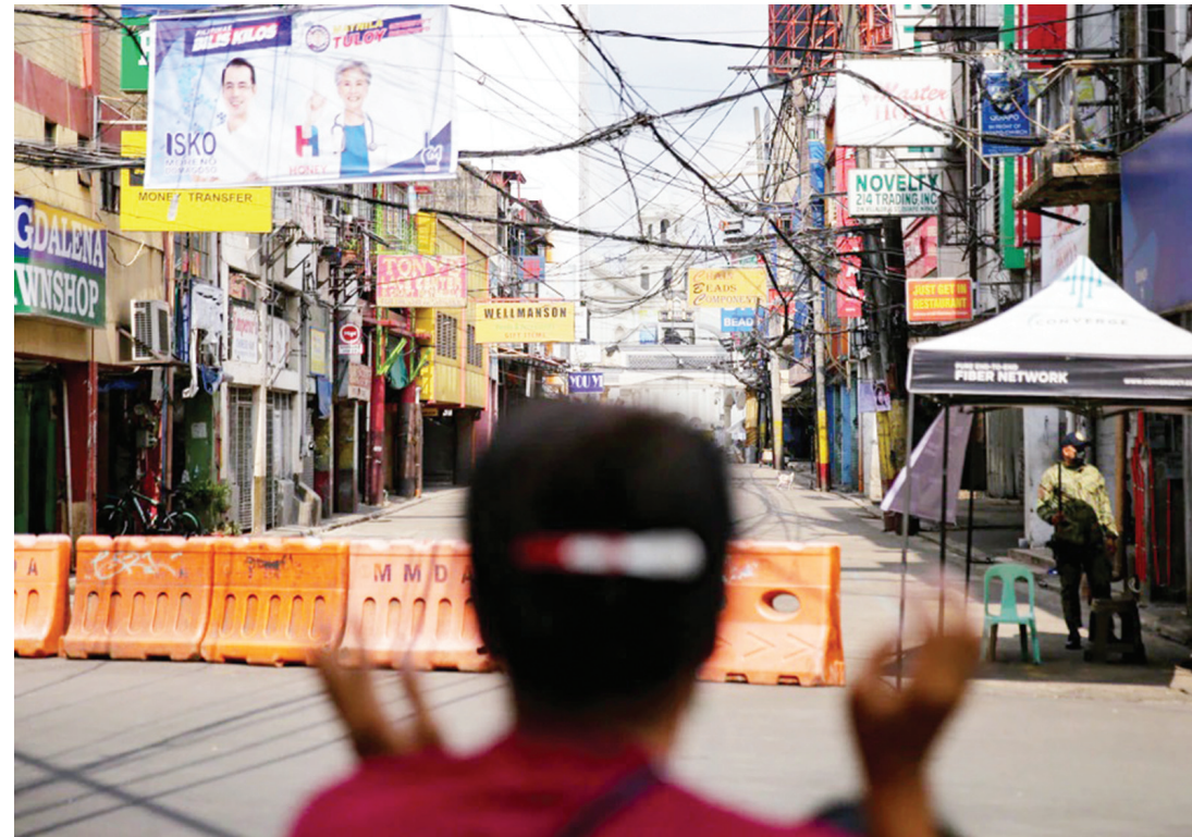
一名黑耶蘇信徒昨日站在離溪仔婆教堂數米外的拒馬前。政府宣佈取消今年黑耶蘇出巡活動，以避免更多人感染新冠肺炎。